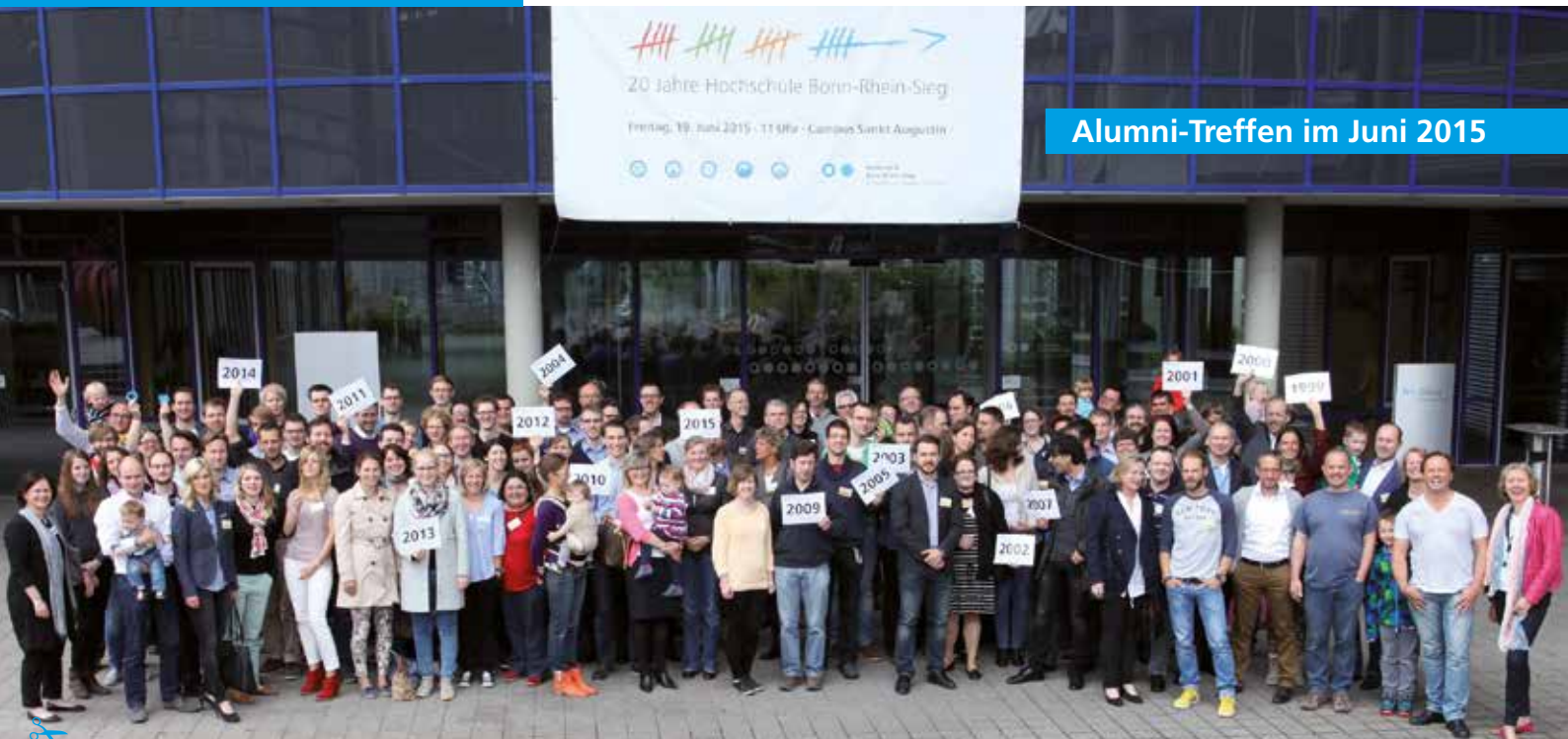
Alumni-Treffen im Juni 2015