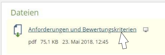
Abb. 6a: Zugriff auf Dateien

In den Kursen finden Sie die einzelnen Materialien . Um Dateien herunterzuladen oder anzusehen, klicken Sie auf die entsprechende Datei (Abb. 6a) oder laden Sie den kompletten Ordner über das Pfeilmenu > „Download“ herunter (Abb. 6b).