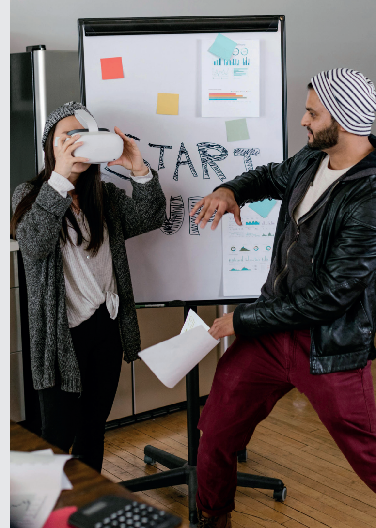
Stand 01/2025